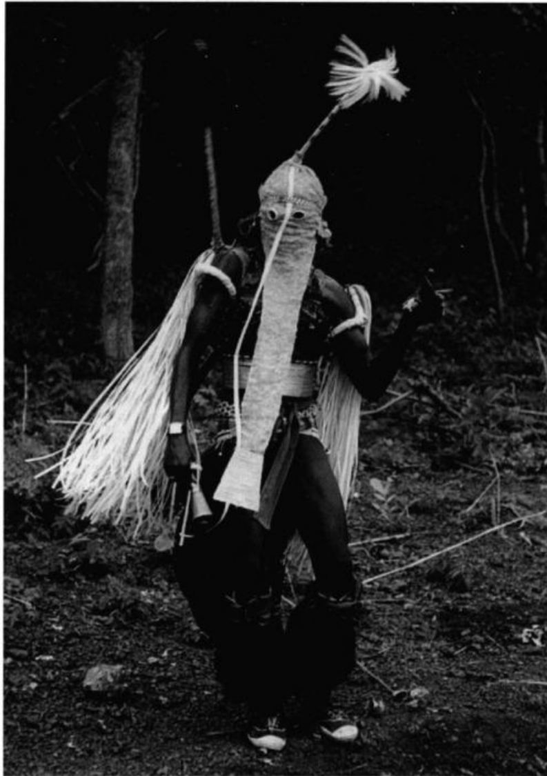
Gwangwuran mask - Etolo, Sénégal

Dans une société qui n'a plus de rite de passage pour ce seuil si puissant qu'est l'adolescence vers l'âge adulte, j'ai envie de m'adresser directement aux adolescents et adolescentes et leur proposer un rituel. Une adresse directe, en mouvement, pleine d'énergie, de transformations qui puise dans l'anthropologie pour réinventer un continuum entre cultures traditionnelles et contemporaines — Sylvie Balestra